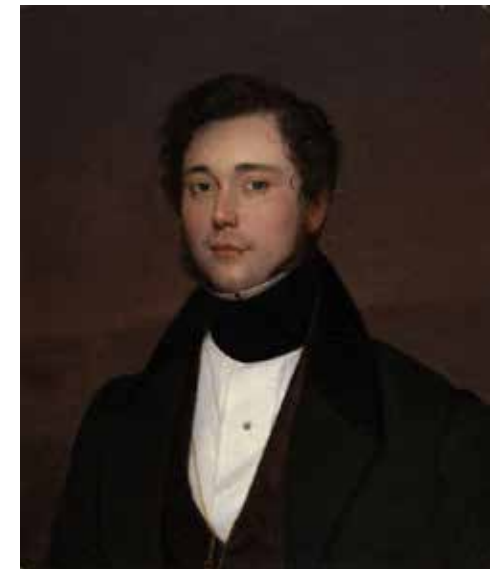
1939.00.178 Portrait d'homme