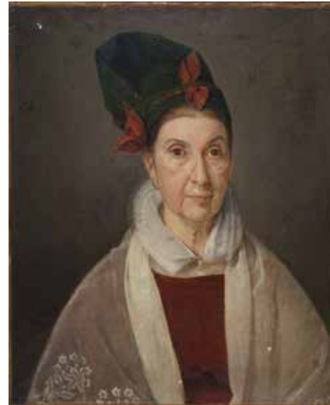
2017.6.7 Portrait CHRESTIEN

Il est surtout célèbre pour la toile que possède le musée du Quai Branly : l'Allégorie de l'abolition de l'esclavage à La Réunion, 20 décembre 1848. Cette importante peinture d'histoire est une vision symbolique de ce jour historique.